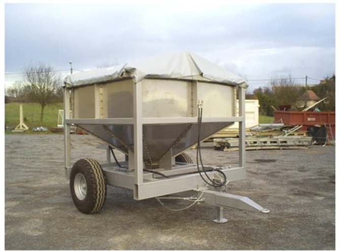
Trémie en INOX 15/10 ème .