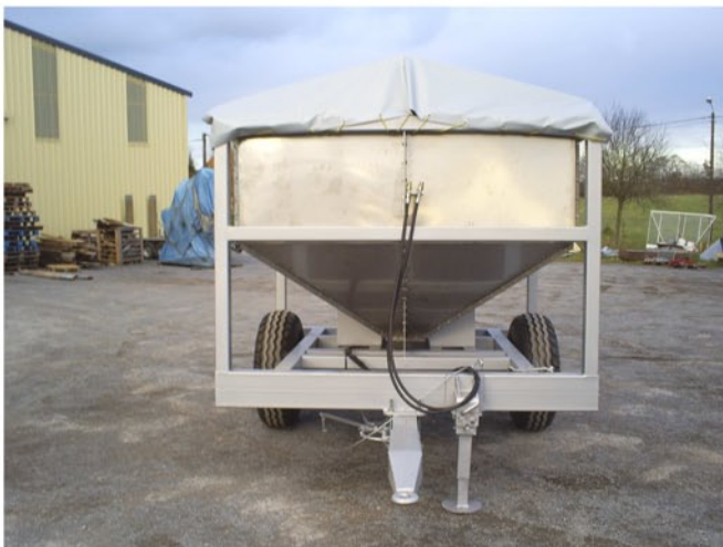
Essieu et flèche démontable.