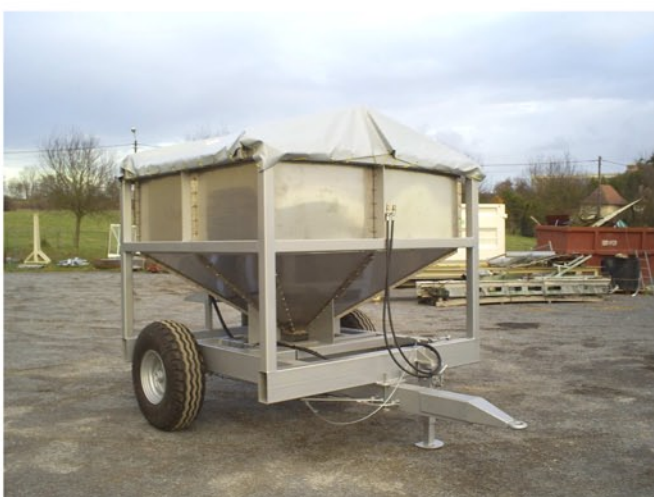
Châssis acier 3 mm grenailé, avec peinture polyuréthane.