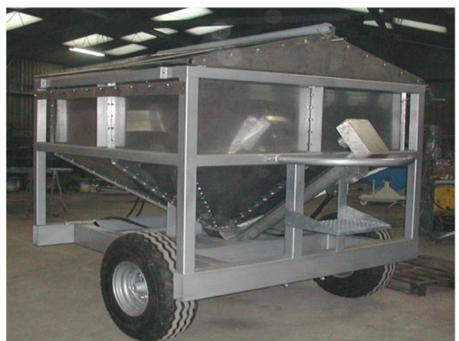
Vis inox Ø 100 mm démontable, avec moteur hydraulique.

Tél. 03.24.38.92.40 – Fax : 03.24.38.93.03